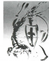
La Chanson de Roland

A la fois mythiques et héros de BD, Roland, Olivier, Ganelon (plus maladroit que traître), l'émir Marsile, ces hommes du passé qui n'hésitent pas à trancher d'un seul geste homme et cheval, nous permettent de jeter un regard amusé sur nos guerres qui n'en finissent pas de se réveiller.